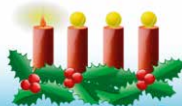
Eine besinnliche Adventszeit wünscht der

Wir freuen uns schon auf die SEEBODNER OPEN 2020!