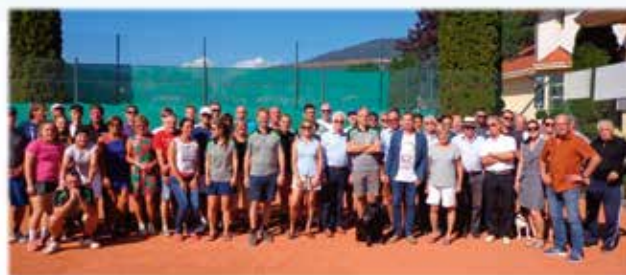
Tolle Stimmung beim Finaltag der SEEBODNER OPEN 2019

1. TC Seeboden / info@tennisclub-seeboden.com / www.tennisclub-seeboden.com