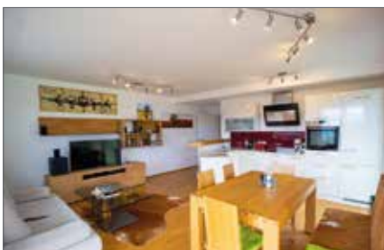
MILLSTATT AM SEE 1080 / 3301

Wfl. ca. 227 m 2 , Gfl. ca. 2.528 m 2 HWB: 69,5 kWh/m 2 a, fGEE: 0,96 Kaufpreis € 985.000,-- Hr. Hinteregger Tel. +43 664 881 79 087