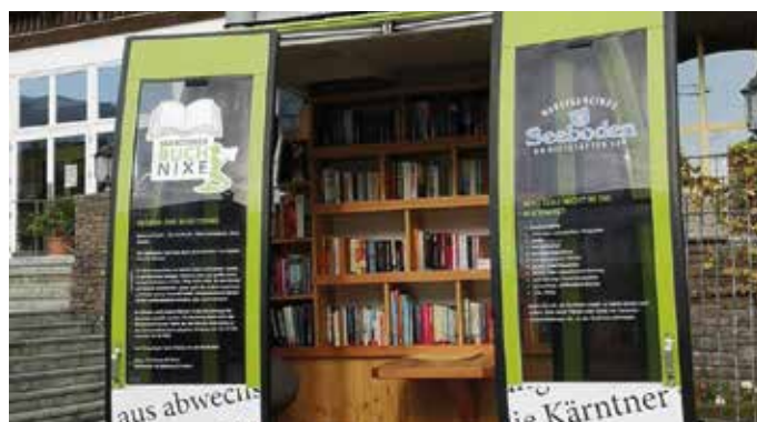
Die Buchnix steht derzeit vor dem Kulturhaus – Bitte halten Sie sie sauber! Viel Spaß beim Lesen!