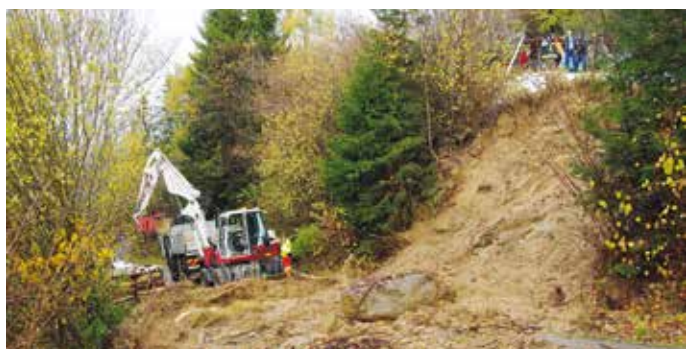
Glück im Unglück nach dem Hangrutsch auf der Tschiermoockstraße. Gemeinsam mit der zuständigen Weggenossenschaft werden wir uns um eine Oberflächenentwässerung bemühen.

(Hangrutschungen, Überschwemmungen) verursacht. In gemeinsamer Arbeit von Bauhof, Wasserwerk und vor allem unseren fünf Feuerwehren haben wir die Herausforderungen bewältigt. Wir sind aber gegenüber anderen Gebieten noch glimpflich davon gekommen!