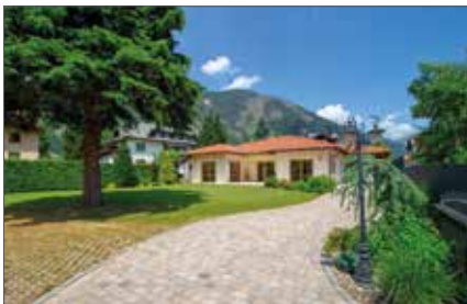
DÖBRIACH 1080 / 3277

Wfl. ca. 69 m 2 HWB: 28,4 kWh/m 2 a, fGEE: 0,69 Kaufpreis € 329.000,-- Hr. Hinteregger Tel. +43 664 881 79 087