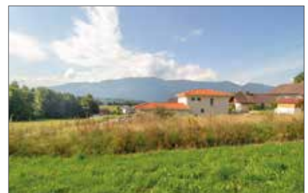
DÖBRIACH 1080 / 3302

Wfl. ca. 52 m 2 HWB: 147 kWh/m 2 a, fGEE: 1,94 Kaufpreis € 125.000,-- Hr. Hinteregger Tel. +43 664 881 79 087