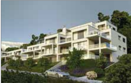
MILLSTATT AM SEE 1080 / 3330

Unser gesamtes Immobilienangebot finden Sie auf unserer Website www.reggerimmobilien.at