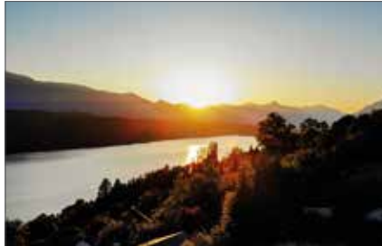
MILLSTATT AM SEE 1080 / 3343

Wfl. ca. 66 m 2 HWB: 28,4 kWh/m 2 a, fGEE: 0,69 Kaufpreis € 309.000,-- Fr. Hämmerle Tel. +43 664 881 79 083