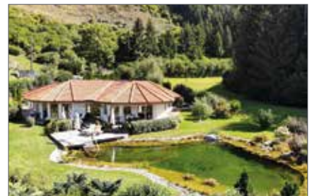
SEEBODEN 1080 / 3284

... mit Kompetenz, Professionalität, Engagement und vor allem Leidenschaft! Anfragen, Beratung und Informationen unter Tel. +43 4762 42 330 oder online