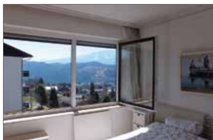
SEEBODEN 1080 / 3242

Wfl. ca. 90 m 2 HWB: 28,1 kWh/m 2 a Kaufpreis € 279.000,-- Fr. Fortschegger Tel. +43 664 881 79 096