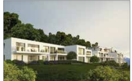
MILLSTATT AM SEE 1080 / 3344

Wfl. ca. 41 m 2 HWB: 28,4 kWh/m 2 a, fGEE: 0,69 Kaufpreis € 199.000,-- Fr. Fortschegger Tel. +43 664 881 79 096