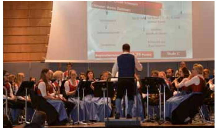
Die Trachtenkapelle Seeboden wurde beim Wertungsspiel in Ossiach zum Landessieger gekürt!

bedeutung. Wir sind sehr stolz auf euch und werden euch im nächsten Jahr zum Bundeswettbewerb nach Graz begleiten und dort unterstützen. Nochmals herzliche Gratulation und ein erfolgreiches Jubiläumsjahr 2016.