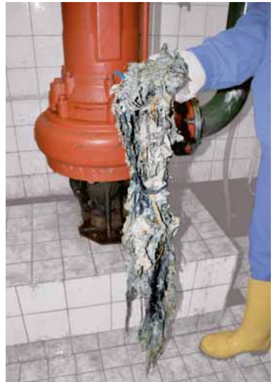
Sieht übel aus und ist es auch: Ein Strang aus verfilzten Feuchttüchern, wie er regelmäßig Abwassersysteme lahmlegt

Daher die Bitte: NICHT in die Toilette werfen! Feuchttücher sind Abfall.