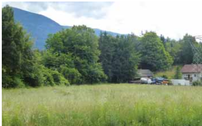
Auf diesem Areal in unmittelbarer Nähe zum Gewerbepark Lumbichl wäre Platz für eine anspruchsvolle Betriebsansiedlung

Wie wir im Vorfeld des Tourismusgesetzes 2011 schon vermutet haben, bringt die Umsetzung Probleme für den Tourismus. Die weithin sichtbaren Beweise dafür liefern leider die Mölltaler, die Spittaler und die Bad Kleinkirchheimer, wo es ordentlich kracht. Wir haben uns das in Seeboden erspart und mit der Einführung des kombinierten Bürger- und Gästeservice im Gemeindeamt die Strukturen erhalten. Damit können wir „überregionale Unzu-